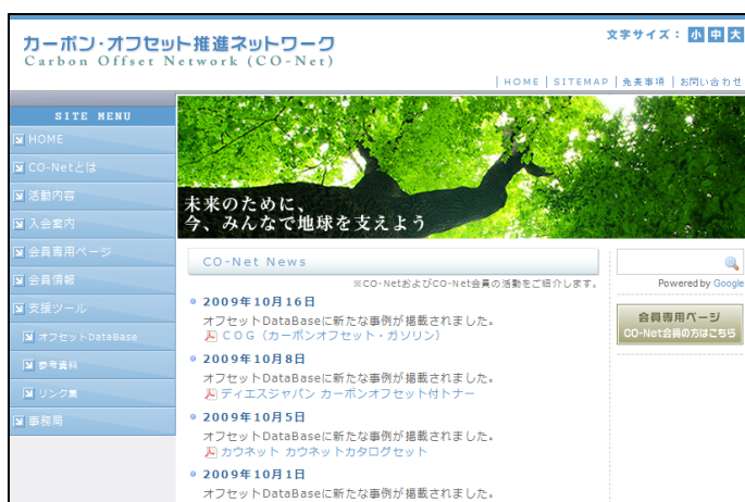
カーボン・オフセット推進ネットワークウェブページ